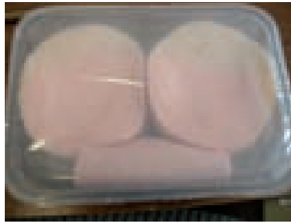
Hamworst in PLA-tray met Natureflex type 1/PLA.

ling”, duidt Peelman. “Tussen de 10 en 100 is een medium barrière. Boven de 100 is een vrij lage barrière: die materialen zijn alleen geschikt voor groente en fruit of voedingsmiddelen die onder lucht worden verpakt.” Tot die laatste groep behoren het multilaags PLA (Bioska) en de combinatie Ecoflex/Ecovio. Een goede barrière voor MAP hebben de Natureflex-films, de combinatie met Cellophane, en Xylophane A. De doorlaatbaarheid voor water blijkt eveneens het hoogst bij de Bioska en Ecoflex/Ecovio, terwijl de gemetalliseerde cellulose-film (Natureflex type 2) en de PLA-tray het beste vocht buiten houden. Ook hier is een waarde van onder de 10 (g/m 2 .d) een vrij hoge barrière, weet Peelman. “Voor echt droge producten zou het echter nog iets lager moeten liggen, onder de 5, maar dat is ook afhankelijk van het voedingsmiddel.” De Bioska en de Ecoflex/Ecovio zijn dus niet geschikt voor droge producten, maar wel voor bijvoorbeeld groente en fruit of als omverpakking. “Gezien de variatie in filmeigenschappen zijn multilaags bioplastics geschikt voor het verpakken van verschillende typen voedingsmiddelen, van kort houdbare en middellang houdbare, tot lang houdbare producten”, concludeert Peelman.