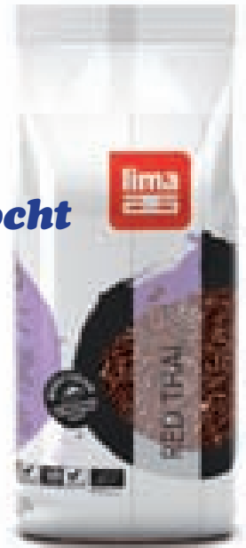
Lima rijst wordt verpakt in een barrière-biofilm op cellulosebasis: de nieuwe, thuiscomposteerbare Natureflex van Innovia Films.

zame verpakkingen) worden nu rijst en pasta's verpakt in een barrière-biofilm op cellulosebasis: de nieuwe, thuiscomposteerbare Natureflex van Innovia Films. Die film is ook voor Ter Beke de basisfolie voor een nieuwe thuiscomposteerbare verpakking voor gesneden fijne vleeswaren. De onderzochte bioplastics zijn verpakkingsfilms of -schalen van hernieuwbare grondstoffen (zie tabel 1). Polymelkzuur (PLA) wordt via fermentatie gemaakt uit mais. Polyhydroxybutyraat (PHB) is een polyhydroxyalkanoaat dat bacteriën aanmaakt. De cellulose voor de Natureflex en Cellophane komt uit houtpulp. En het xylaan van Xylophane A wordt gewonnen uit agrarische bijproducten, zoals graanze-