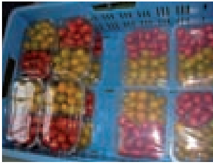
Tomaten in PLA-trays met daarover meerlaags PLA.

De resultaten zijn overwegend positief voor de kort- en middellang houdbare producten. De geteste multilaags bioplastics vormen voldoende barrière tegen zuurstof en koolstofdioxide om de houdbaarheid van de geteste voedingsmiddelen te garanderen. “Bij bijna alle metingen scoorden de bioverpakkingen even goed als de conventionele film”, vertelt Peelman. “Alleen in de sensorische beoordeling zagen we bij hamworst meer verkleuring in de bioverpakking dan in de conventionele verpakking.”